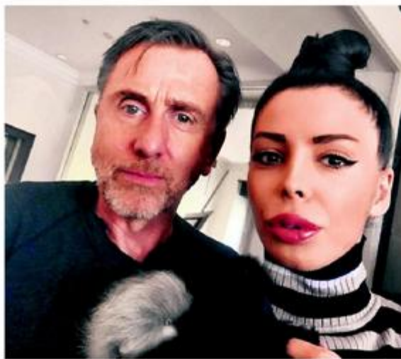
Naša novinarka 'ulovila' je britanskoga glumca